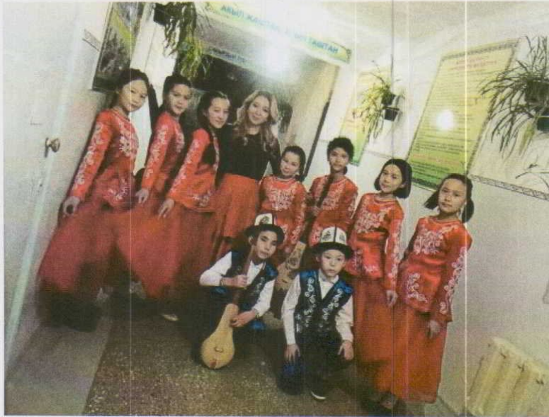
Андан тышкары мектепте бий ийрими иштейт жан 1-5-класстын окуучулары катышышат