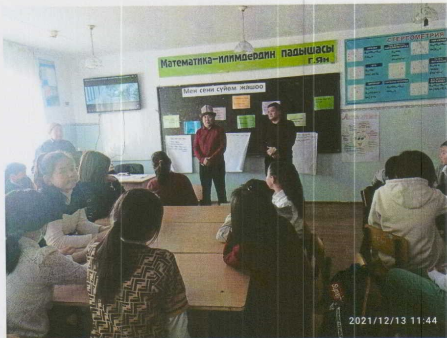
«Зордук зомбулуктун алдын алуу» боюнча тарбиялык саат