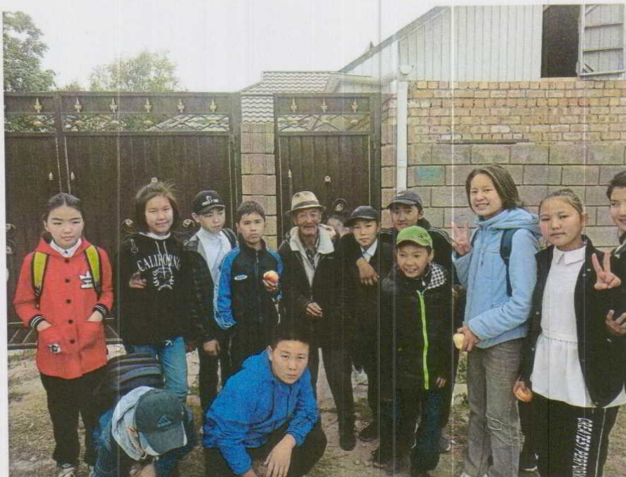
Карылар күнү «Тимурчулар командасы»