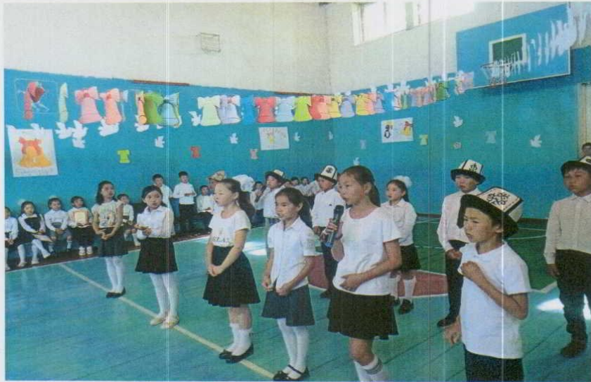
«Акыркы коңгуроо» аземи