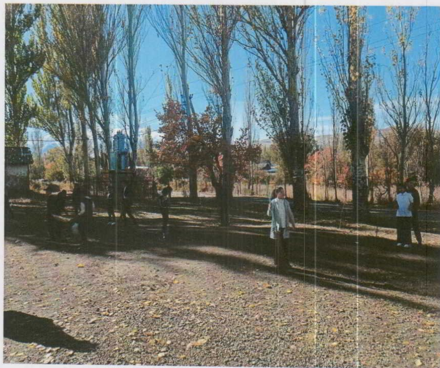
Мектепте тазалык боюнча иш чара