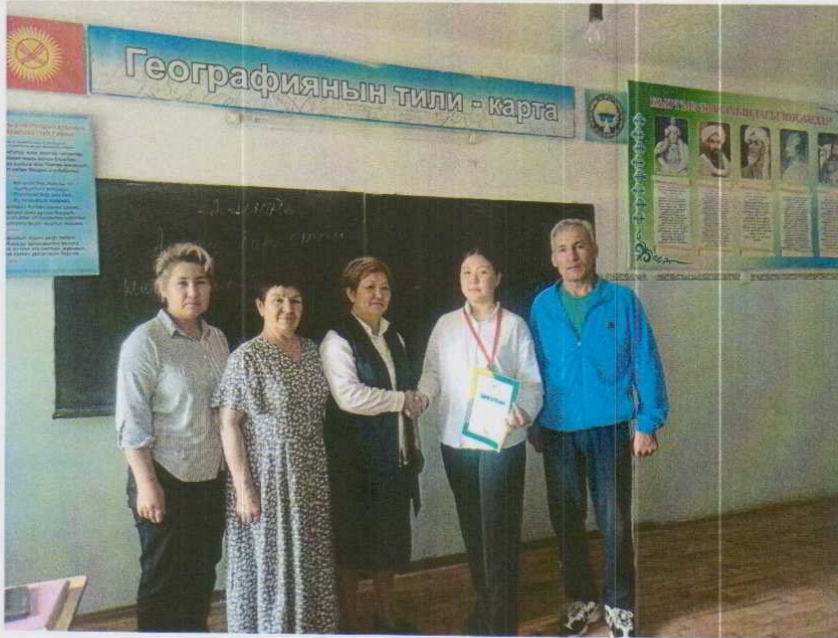
Окуучулардын спорттогу жетишкендиги.