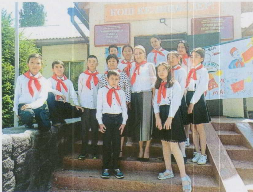
«Пионерлер күнүнө» карата иш чара