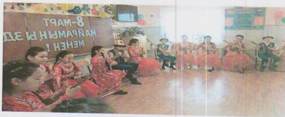
8-март майрамына карта иш чара