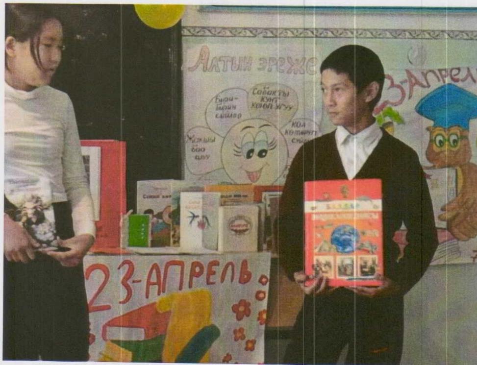
Күз майрамына карата иш чара